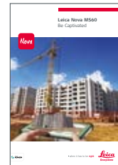
Leica Nova MS60